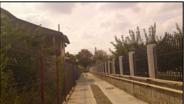
DRUM ACCES VEDERE SPRE BD REPUBLICII